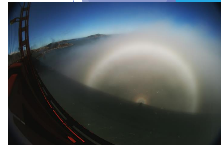
サンフランシスコの白虹